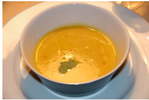
Garnelen mit Basilikum und Graved Lachs, Frischkäseterrine mit Avocado, Pikante Mango Suppe